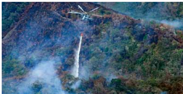
Un helicóptero. Con sistema Bambi bucket en la zona de la Florida en Amazonas

En ese sentido, la gobernante aseguró a la población que van a atender los incendios, así como