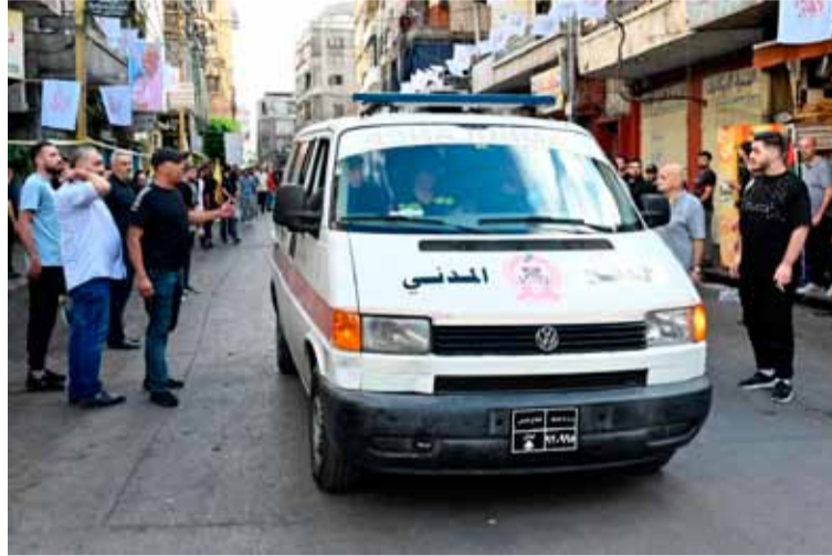
Fatal. En el segundo ataque murieron 12 personas y hubo 900 heridos

En tanto, el Comando del Ejército libanés emitió un comunicado instando a los ciudadanos a no reunirse cerca de los lugares de los incidentes para permitir la entrada de los equipos médicos.