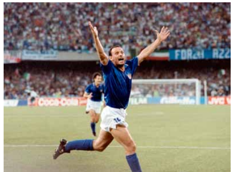
"Toto" Schillaci, el histórico goleador

Lejos de caer anímicamente, Argentina reaccionó rápidamente y apenas minutos después del empate, Matías Rosa volvió a marcar la diferencia: en una brillante jugada individual dentro del área, dejó a dos defensores afganos en el camino con amagues y una gambeta corta, para