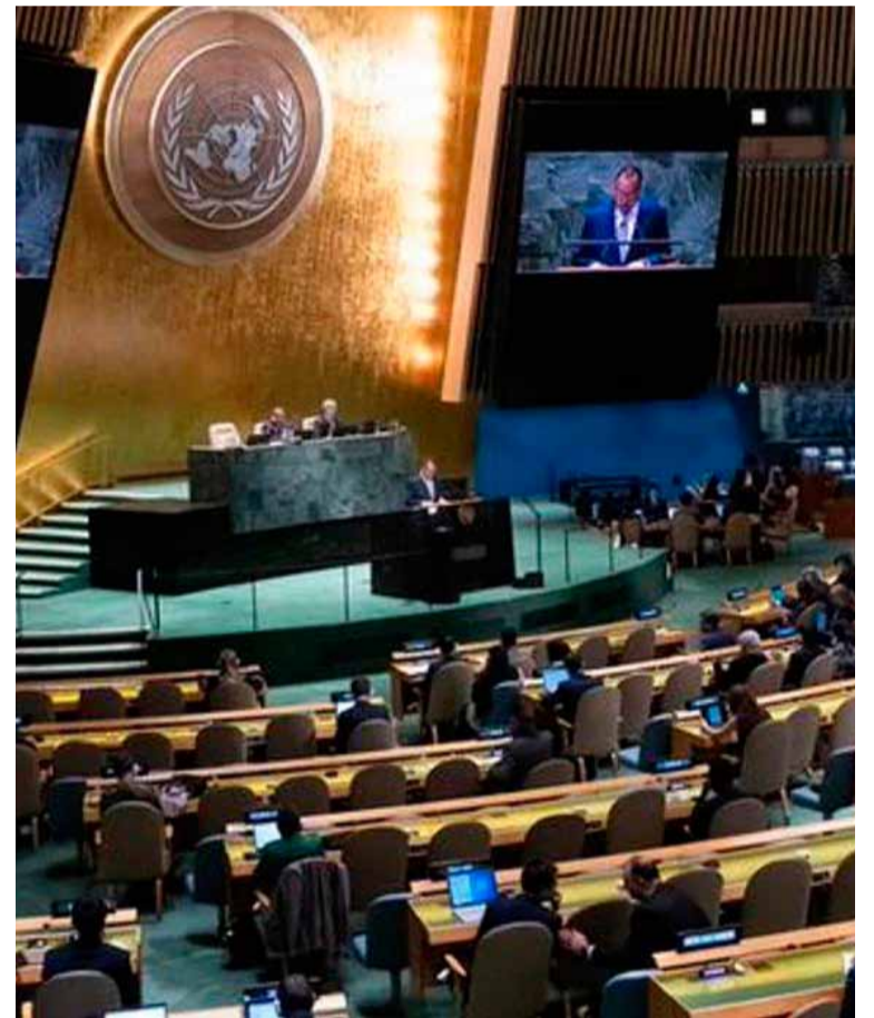
La Asamblea de la ONU. Ordena a Israel retirarse del territorio palestino

El texto exige además a Israel que devuelva las tierras confiscadas a los palestinos, permita el retorno de los desplazados por los asentamientos y proceda a las reparaciones a los damnificados, y pide además a la comunidad internacional que no reconozca las consecuencias territoriales, legales ni demográficas de la ocupación de tierras palestinas.///