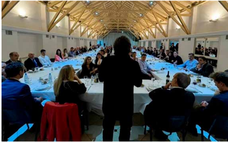
El presidente junto a los diputados, en la cena en la Quinta de Olivos

En la antesala a la mesa, uno a uno, los legisladores formaron fila, pasaron su tarjeta por un PosNet, el mismo que se utiliza en Casa Rosada para cobrar los tickets del comedor, y abonaron