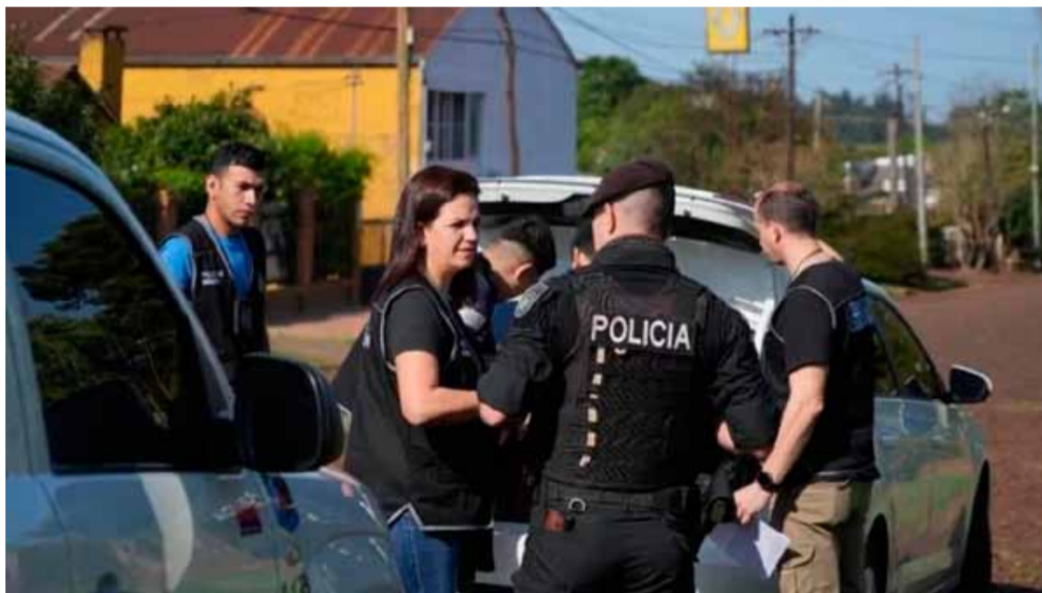
Operativo. En casa de la pareja del ex diputado Kiczka

En la casa de la pareja del ex diputado Germán Kiczka se realizó un allanamiento, en el cual se encontraron dos computadoras en el patio de la vivienda.