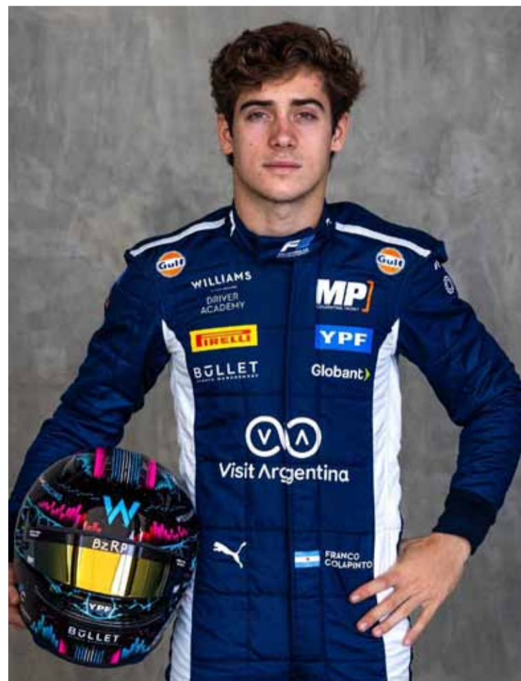
Franco Colapinto tendrá su primera vez en el Gran Premio de Singapur

Lejos de pasar de largo, Colapinto se tomó un tiempo para saludar a cada uno, sacarse fotos, grabar algún video y firmar autógrafos, al igual que su compañero Alex Albon.