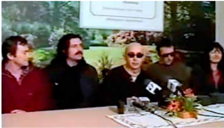
La conferencia. En el escritorio que ahora sale a remate