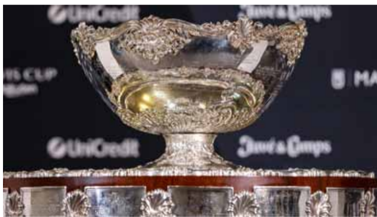
La "ensaladera de plata", el trofeo que todos quieren

Durante el reciente torneo en Manchester, el equipo argentino dirigido por Guillermo Coria logró clasificar a las Finales de Málaga tras un desempeño que incluyó victorias ante Finlandia y Gran Bretaña, y una derrota ante Canadá. Este será el último año en que se utilice el formato