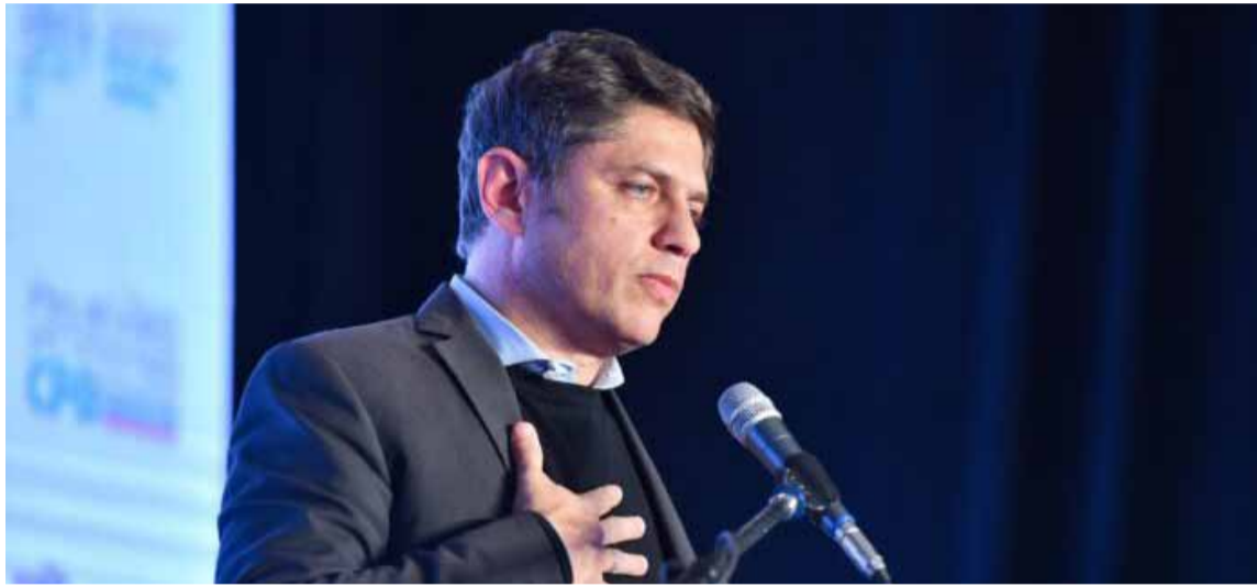
El gobernador de la provincia de Buenos Aires, Axel Kicillof

El gobernador lanzó nuevos dardos contra el presidente Javier Milei