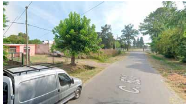
Lugar del hecho. El hombre fue atacado en 521 entre 208 y 209

Tras ratificarse la denuncia de la joven y corroborar que también había sido atendida en el hospital Alejandro Korn de Melchor Romero, la Justicia determinó la detención del hombre y se abrió una causa caratulada como "averiguación de ilícito por presunto abuso sexual". (DIB)